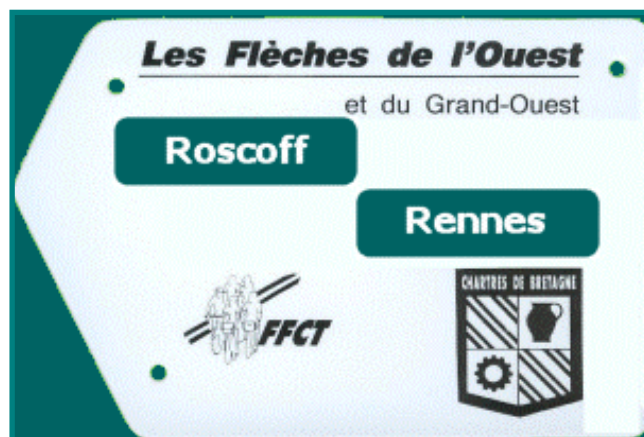
Plaque de cadre des Flèches de l'Ouest