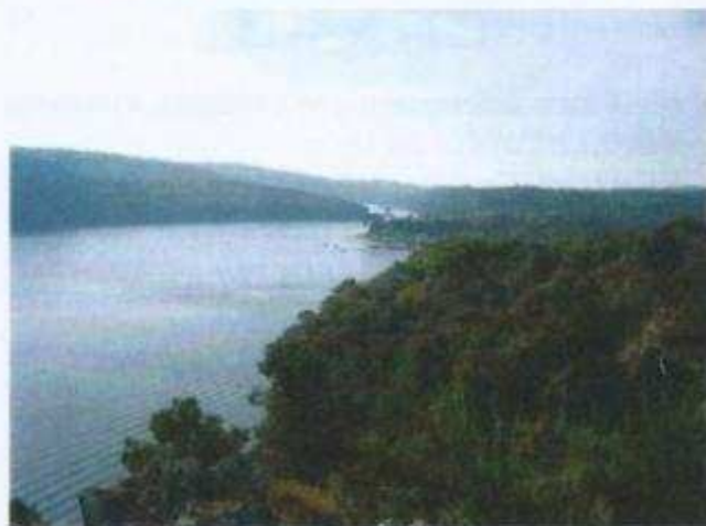
Vue sur le lac de Guerlédan et la plage de Beau Rivage

Site : http://pagesperso-orange.fr/cyclotourisme-akleg/cariboost1/crbst_0.html#anchor-top