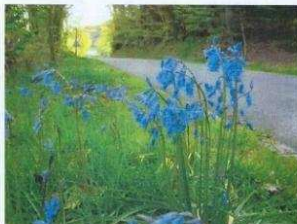
Jacinthes des bois